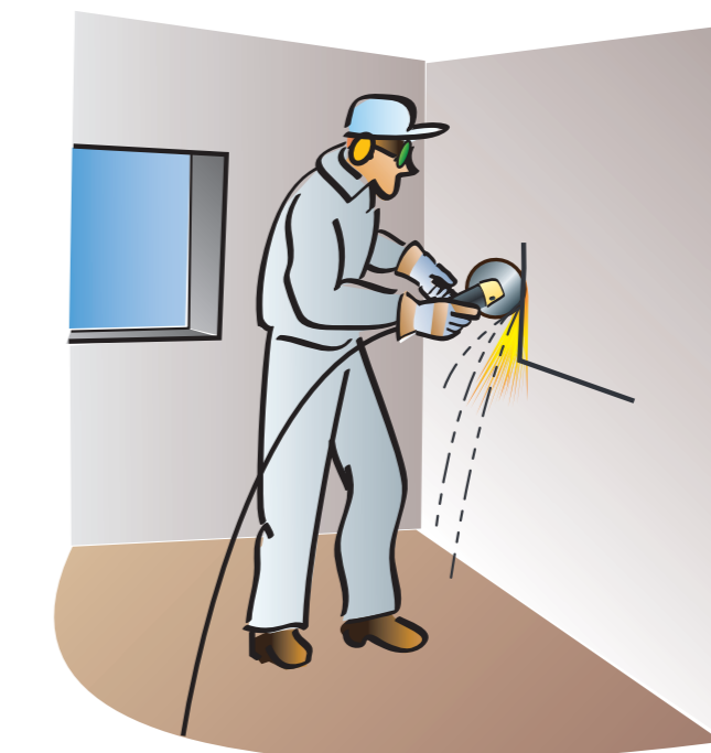
Skæring med vinkelsliber i bygningsdele af murværk eller beton kan være varmt arbejde

Vær opmærksom på, at mureren kan have andre arbejdsopgaver, der kan forårsage ildebrand. Desuden kan der indgå arbejdsopgaver, som i denne folder er beskrevet under andre fag.