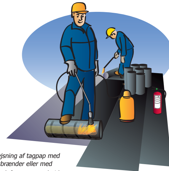
Svejsning af tagpap med gasbrænder eller med varmluft er varmt arbejde