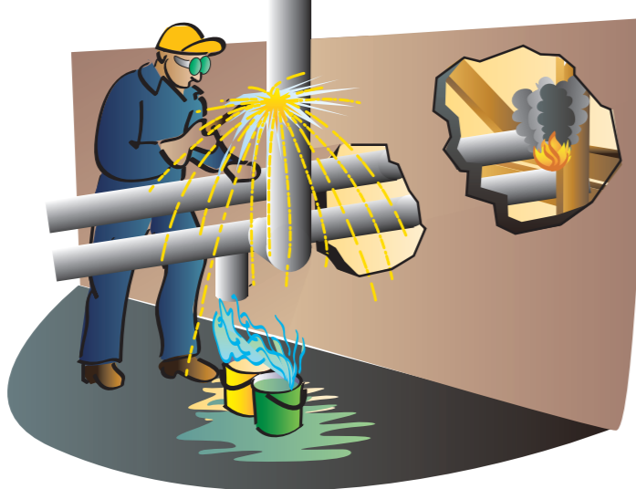
Skæring i metal med skærebrænder, vinkelsliber og lignende er varmt arbejde

Vær opmærksom på, at maleren kan have andre arbejdsopgaver, der kan forårsage ildebrand. Desuden kan der indgå arbejdsopgaver, som i denne folder er beskrevet under andre fag.